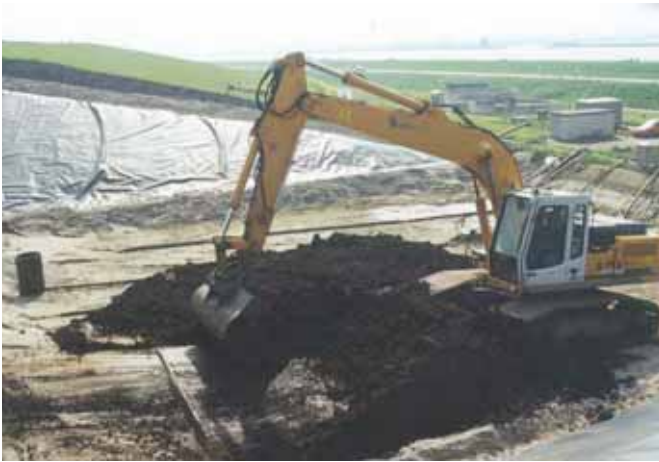
FIGUUR 3: EERSTE VRACHT. (BRON: ECN).